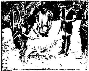
नेफा के एक शांतिकेन्द्र में